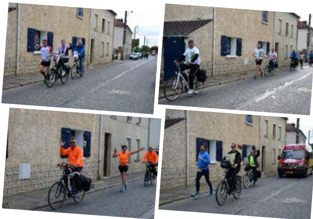
Une course dans la bonne humeur.