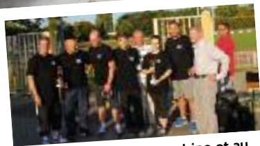
1er prix au tir à la carabine et au pistolet pour l'équipe de Villeron