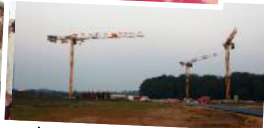
Les grues, des oiseaux migrateurs qui ont fait leurs apparition à Villeron