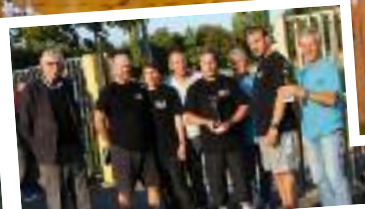
1er prix ex aequo au lancers francs pour Villeron et Le Mesnil-Aubry