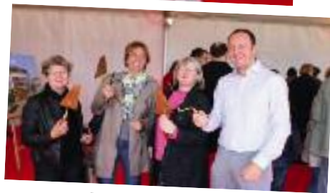
Des élus bâtisseurs