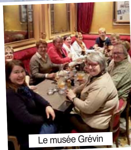
Le musée Grévin

Ces 4 derniers mois, nous avons pu aller à la cueillette des champignons mais sommes rentrés avec une faible récolte due au manque d'eau. Par contre nous avons passé un excellent après-midi de marche.