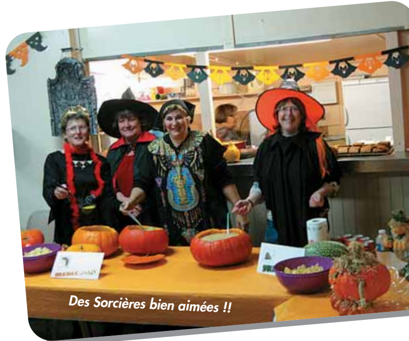
Des Sorcières bien aimées !!

Comme le dit le proverbe : « tout ce qui est petit est mignon », voilà, comment on pourrait qualifier ce 1 er marché de Noël. Malgré sa taille, il a été très apprécié des nombreux visiteurs comme des exposants. Les stands proposaient des cadeaux originaux ainsi que des produits alimentaires de grande qualité. Tout le week-end, le stand restauration, a proposé une dégustation de soupe de pois cassés aux lards, des huîtres de Marennes Oléron, du vin chaud, des biscuits à la cannelle. Mais, également sur les stands : le champagne, le vin de Sancerre, le saumon, le miel, le pain d'épice, les biscuits bretons, le crottin de Chavignol et de nombreuses personnes ont pu ainsi passer leurs commandes pour les fêtes.