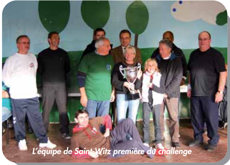
L'équipe de Saint-Witz première du challenge

Précision importante pour clore ce point, nous avons eu un temps superbe et pour l'ASL, c'est la manifestation la plus accomplie de la saison.