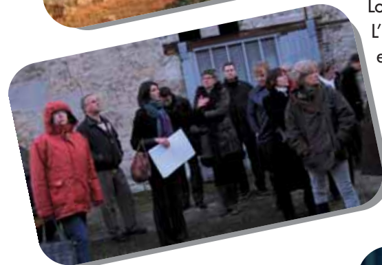
La Tour Saint Rieul

Petit rappel : Chaque été en juillet et en août, des ateliers Archéologie sont organisés sur le site d'Orville à Louvres pour les enfants de 6 à 12 ans. L'été 2008 a vu la participation de 116 enfants. Pour tout renseignement sur les sessions 2009, vous pouvez joindre le 01.34.31.30.31 ou adresser un mail à archea-info@roissy-online.com