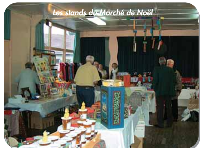
Les stands du Marché de Noël

Comme le dit le proverbe : « tout ce qui est petit est mignon », voilà, comment on pourrait qualifier ce 1 er marché de Noël. Malgré sa taille, il a été très apprécié des nombreux visiteurs comme des exposants. Les stands proposaient des cadeaux originaux ainsi que des produits alimentaires de grande qualité. Tout le week-end, le stand restauration, a proposé une dégustation de soupe de pois cassés aux lards, des huîtres de Marennes Oléron, du vin chaud, des biscuits à la cannelle. Mais, également sur les stands : le champagne, le vin de Sancerre, le saumon, le miel, le pain d'épice, les biscuits bretons, le crottin de Chavignol et de nombreuses personnes ont pu ainsi passer leurs commandes pour les fêtes.