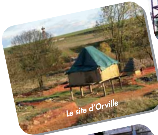
Le site d'Orville

Par un après-midi ensoleillé, les participants se sont successivement rendus sur le chantier du futur musée, au Musée de la Tour Saint Rieul à Louvres, sur le site d'Orville dont le château a été témoin de la guerre de Cent Ans, mais aussi sur le site de Fosses/Vallée de l'Ysieux qui retrace mille ans d'activité potière.