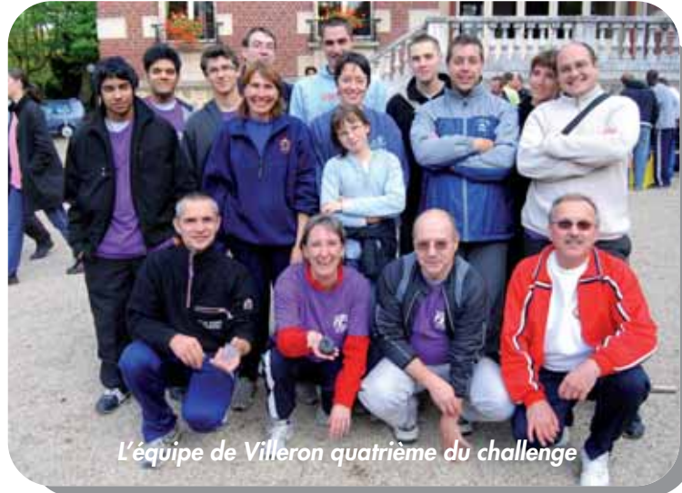
L'équipe de Villeron quatrième du challenge