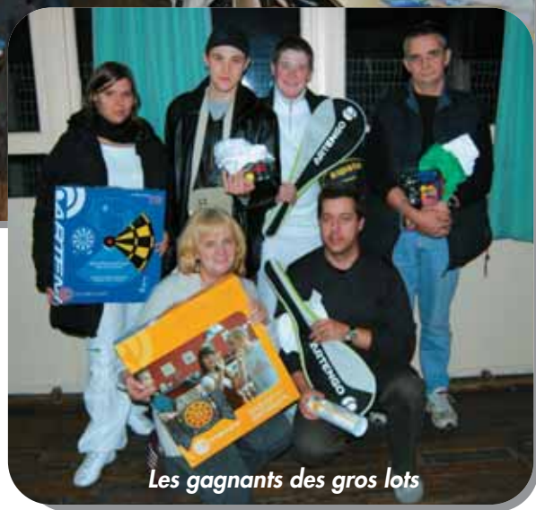
Les gagnants des gros lots